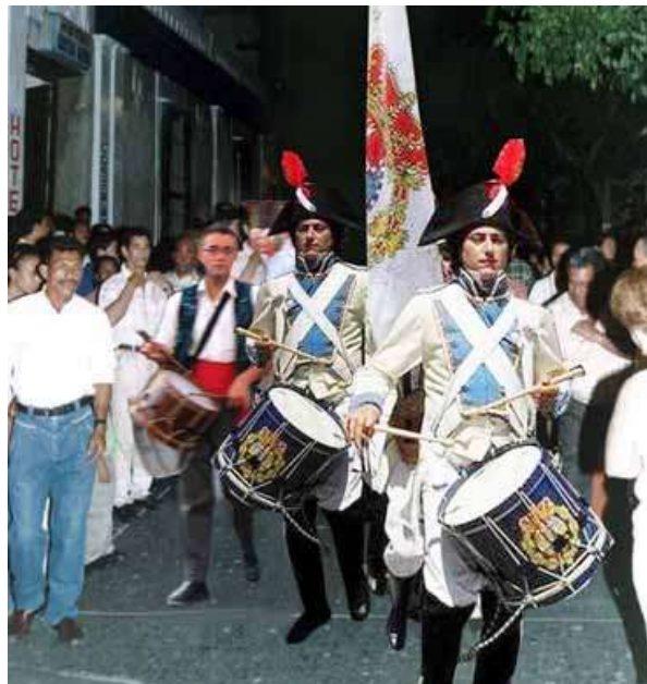
Representación escénica del desfile de la guarnición samaria

Propósito: Realizar un acto de recreación histórica, tal como lo vivieron los samarios hace 200 años, para el deleite de propios y extraños. Este evento es parte de la construcción del turismo cultural de Santa Marta, que se constituye en la promoción de una nueva imagen turística de la ciudad.